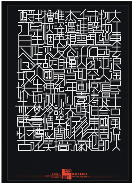
图 1-2 靳埭强作品

十年来不变的程式化练习。我们需要更加明确地指出其构成的理论是如何与无数新鲜的视觉设计相互依存的,学习了构成之后是如何将其应用到设计之中的。应该以专业视点来观察事物,即训练自己以专业的视点来观察物体的形态,考察其基本形态元素是什么,这些基本元素是怎么形成并组合起来的以及它和同类形态事物的关系等,进而整理出一些组合规律。这就是一个设计师所要涉及的工作之一。而随着设计领域的不断变革和拓展、转变,构成的宗旨在运用基本元素、按照一些规律去探讨更多组合的同时,在材料、媒介或空间的运用上也进行了广泛性的探讨。在具体操作上,在课程之外就要明确自己的专业方向,以专业的角度去分析事物所需要的形态。