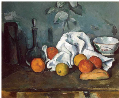
图 1-3 保罗·塞尚作品