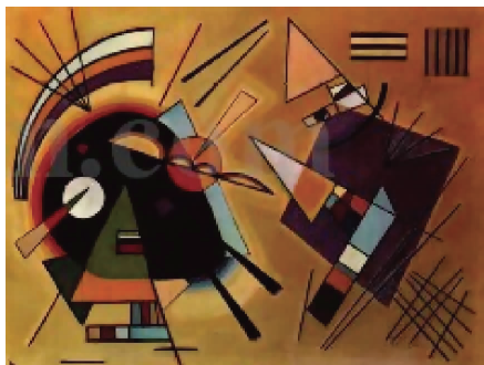
图 1-4 瓦西里·康定斯基作品

点评:19 世纪下半叶,法国印象派代表画家保罗·塞尚得出了视觉世界的物体都是由集合体构成的结论。