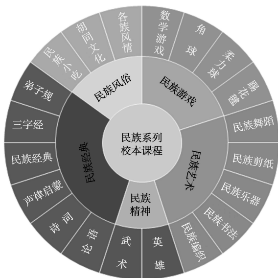
图 1-3 民族特色校本课程体系