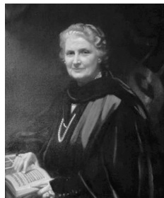
图 1-1 蒙台梭利画像

玛丽亚·蒙台梭利(Maria Montessori,1870—1952)是意大利第一位女医学博士,第一所“儿童之家”的创办者。她既是杰出的幼儿教育思想家和改革家,又是西欧著名的新教育思想家。她毕生致力于探索科学的教育,提倡在自由的氛围中让儿童获得发展,并且在以“发现儿童”为主旨的教育实践活动的基础上,创立了一套独特的幼儿教育理念。至今,蒙台梭利教学法在全球早期教育领域有着广泛的影响。蒙台梭利画像如图 1-1 所示。