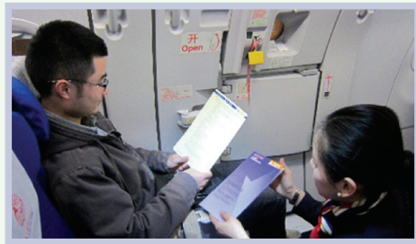
emergency exit row / exit seat 紧急出口旁的座位