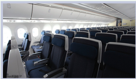
Economy Class 经济舱