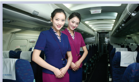
flight attendant 空姐，空少，空中乘务员