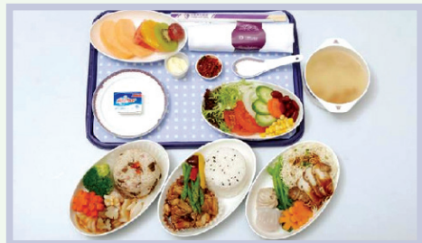
Dinner for First Class 头等舱正餐