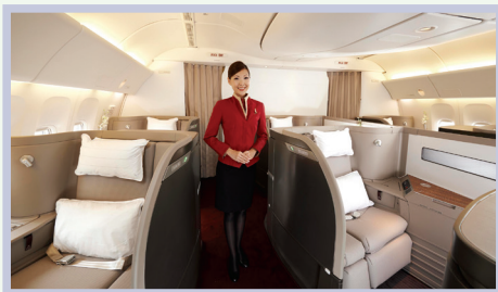
First Class 头等舱

登机牌上类似于 15C 的数字和字母组合代表旅客的座位号。A、B、C 等字母代表座位列数，1、2、11、12 等数字表示排数。不同机型的客机的座位号表示略有不同，但表示方法基本相同。