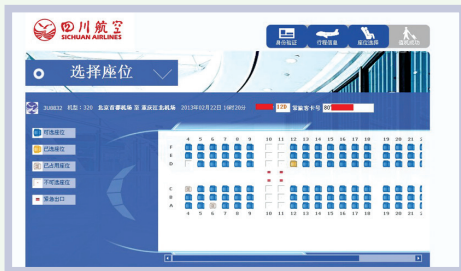
online seat selection 网上选座