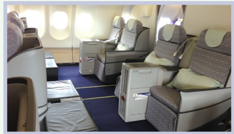
Business Class 商务舱