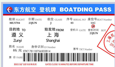
boarding pass / boarding card 登机牌