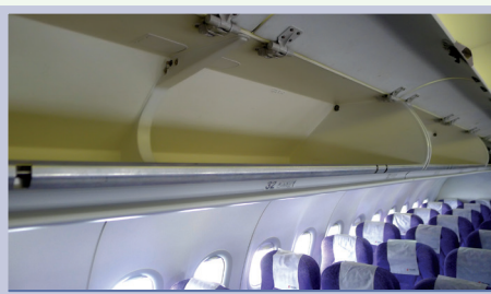
overhead compartment / overhead bin 飞机行李架，置物柜