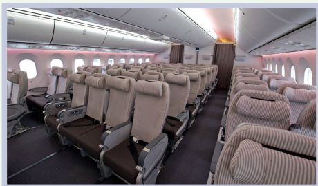
front row seat / middle seat / back seat 前排座位 / 中间座位 / 后排座位